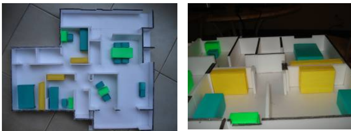
Figura 5 - Fotos dos modelos físicos utilizados na técnica “Brincando de Boneca” do grupo focal em estudo de caso