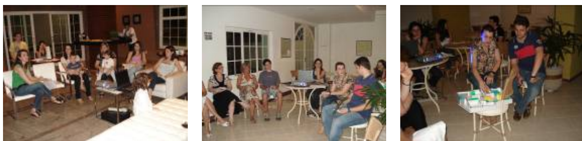
Figura 2 - Fotos das dinâmicas propostas no grupo focal dos respectivos estudos de caso

respostas. Tal procedimento gerou uma discussão bastante desenvolvida sobre os diversos aspectos e significados do morar, levando os participantes a reflexões, além de elevado nível de descontração, o que contribuiu para que se pudesse captar questões subjetivas. O uso dessa técnica no GF teve como principal objetivo propor temáticas ainda não habitualmente pensadas pelos participantes, que tiveram, inclusive, dificuldades em separar e eleger questões sentimentais (feliz, harmônica, aconchegante, etc.) e físicas (pequena, quente, iluminada, etc.). Nesse sentido, pretendeu-se ouvi-los sobre assuntos para os quais eles ainda não haviam preparado um discurso prévio (espontaneidade), na medida em que os moradores tinham de responder rapidamente às questões sem tempo suficiente para articular pensamentos e, portanto, expressar sentimentos maquiados. Como resultado obteve-se uma abordagem mais reflexiva por parte dos moradores participantes que puderam, através do jogo, se mostrar mais próximos de sua realidade, portanto de sua essência (Figura 2).