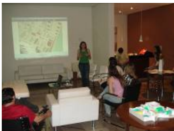
Figura 3 - Foto da dinâmica “Seleção Visual” proposta no grupo focal do estudo de caso J