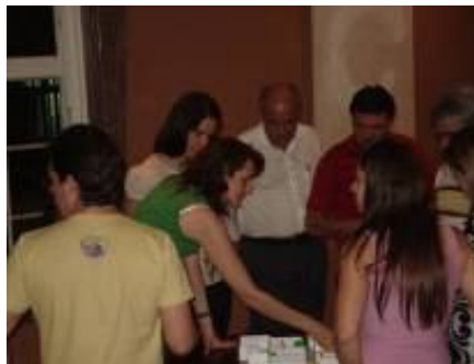
Fig.03 – Brincando de Boneca possibilitada pelo uso do modelo físico do apartamento tipo do edifício avaliado e pela interação dos moradores participantes. Fotos do Grupo Focal de um estudo de caso realizado na cidade de Ribeirão Preto, SP, em junho de 2007.

Nesta etapa final do GF os moradores se mostraram mais à vontade para demonstrar seus desejos e expectativas em relação ao seu próprio apartamento. O uso do modelo físico como uma “brincadeira de boneca” pôde dispor aos participantes uma forma mais simples e descontraída de expor seus sentimentos e, após a sugestão visual, estes demonstraram alto nível de descontração e envolvimento com a dinâmica, indicando já uma visão mais crítica do espaço em que habitam.