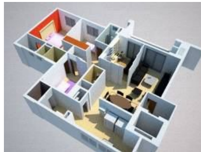
Fig.02 – Foto da dinâmica proposta no Grupo Focal de um estudo de caso realizado na cidade de Ribeirão Preto, SP, em junho de 2007. Sugestão Visual demonstrada pelo equipamento Datashow.

C. Brincando de Boneca: Para finalizar o GF, foi criada uma técnica intitulada “brincando de boneca”, que se utilizou de meios tridimensionais (modelo físico ou maquete tridimensional física do apartamento tipo) a fim de facilitar a expressão dos resultados por parte dos moradores. A aplicação teve com principal objetivo identificar os desejos dos moradores participantes, seus sonhos e expectativas em relação à sua moradia. Notou-se após a leitura dos resultados da aplicação da técnica “brincando de boneca” que os principais objetivos sugeridos foram atendidos, indicando resultados significativos e expressivos.