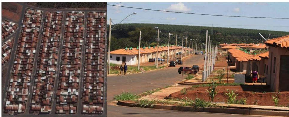
Figura 1 – Área de estudo – Bairro Shopping Park

O Shopping Park é o maior empreendimento de habitação social já construído na cidade de Uberlândia, MG. A área foi destinada a produção de mais de 3000 unidades habitacionais térreas do MCMV, dentro da faixa de renda 1 durante os anos de 2010-2013 (Figura 1). O bairro se estabeleceu lentamente, contudo, a partir de 2004 sofreu um crescimento exponencial entre os anos de 2007-2009. Entretanto, após anos de sua entrega, fica claro que a iniciativa falhou com relação aos seus propósitos iniciais de ofertar “moradia digna” para a população. Atualmente, o empreendimento apresenta um vasto conjunto de problemas construtivos, sociais e ambientais. Entretanto é possível perceber o caráter adaptativo inerente dos moradores, que persiste através de diversas soluções apesar dos problema construtivos das unidades habitacionais e falta de infraestrutura pública de modo geral.