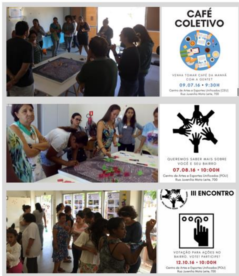
Figura 3 – Algumas coproduções realizadas